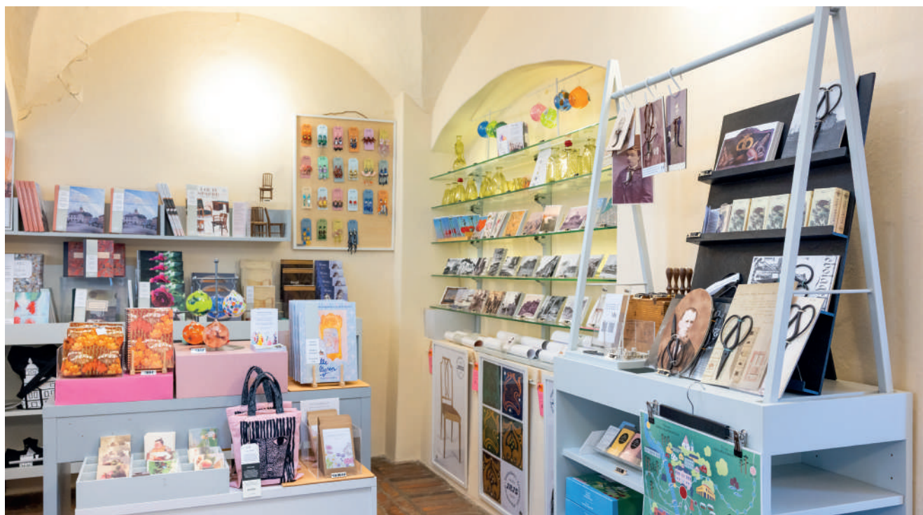
Museibutiken i Holmska gården.

Då museets server började närma sig slutet på sin användningstid började man planera för en ny lösning. Som alternativ granskade man en ny server, en serverhall samt ett Entra-ID-system för identitetskontroll, som stöder Microsoft 365. Man valde Entra-ID, som förbättrar datasäkerheten och apparatkontrollen. Utgående från det här beslutet började vi städa upp de gemensamma mapparna på servern, som därefter flyttas över till Sharepoint, medan vi flyttade över användarnas egna filer till OneDrive.