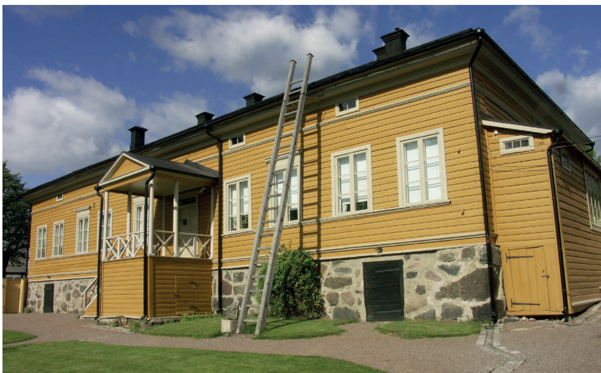
J. L. Runebergs hems huvudbyggnad.

Utställningen Hela folkets Runeberg monterades ner i maj och föremålen återbördades till sina förvaringsplatser. I huvudbyggnaden fortsatte fönsterreparationerna på beställning av Senatfastigheter. Den trästege som leder upp till taket på gårdssidan förnyades