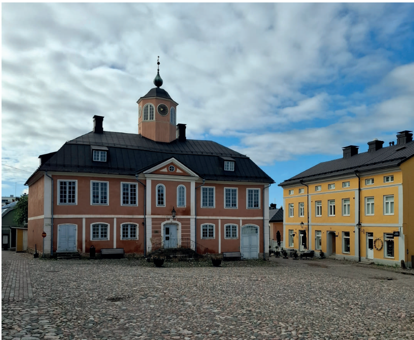
Gamla rådhuset i juni.

Museimagasinet's nätförbindelse förbättrades 7.1 med en Extender 5G förstärkare. Den 24.10 gjordes en brandsyn i museimagasinet.