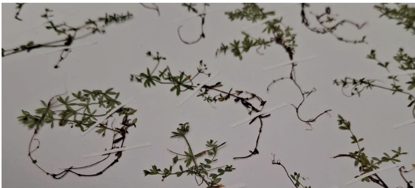
Bild från herbariet donerat av Karl-Gustav Widén.

Ifråga om forskningen överskreds målen genom att man med utomstående finansiering kunde undersöka museets samlingar av textilprover. Forskningen i anslutning till Ekon utökade i sin tur kännedomen om samlingarna, och detsamma gällde för de externa samlingarnas del materialet i Yrjö A. Jänttis och Walter Runebergs samlingar.