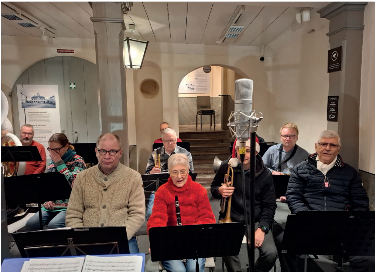
Borgås och Finnbynejdens hornorkestrar spelade i Rådhuset vid utlysandet av julfriden.