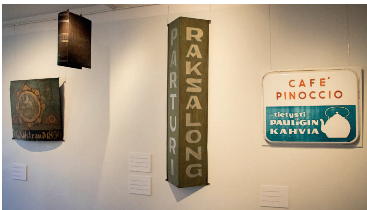
Skylltar från utställningen Vi betjäna på Holmska gården.

Utställningen är en del av förnyelsen i museets utställningsverksamhet. I utställningsarbetsgruppen ingick Juha Jämbäck, Mai Joutsalainen, Inari Porkka och Antti Juntunen. För upphängningen ansvarade museimästaren Katja Sillanpää.