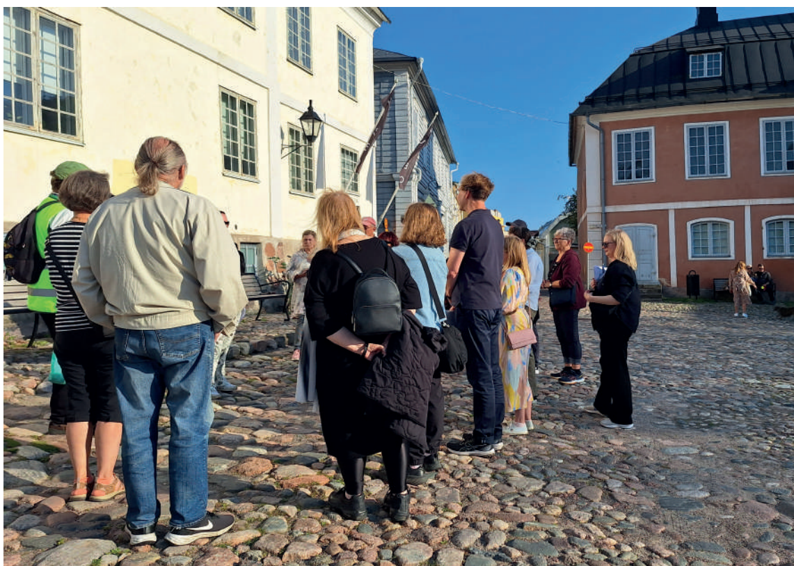
Vi betjänar-rundvandring.

En Vi betjänar-rundvandring i samarbete med AVA-teamet. Se pt 3.1.1.