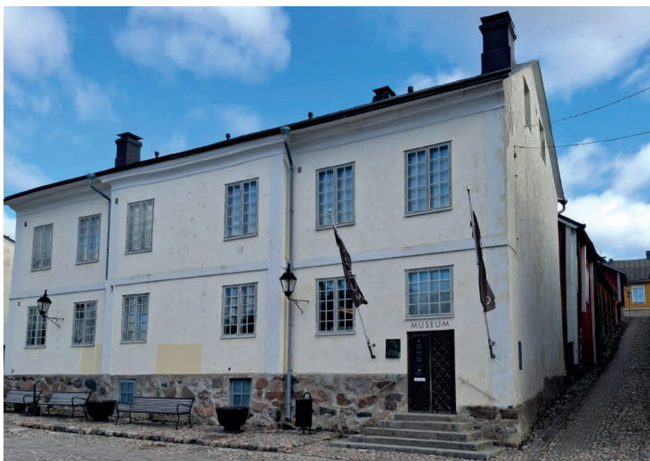
Holmska gården i början av april.

I Borgå museums organisation ingår 21 museiexperter.