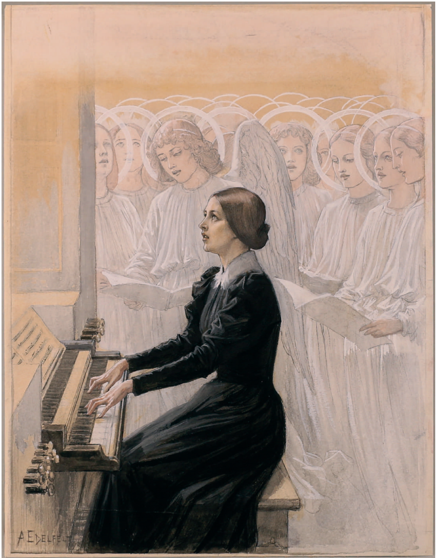
I höstas fick museet en betydande donation till sina konstsamlingar, Albert Edelfelts Den heliga Cecilia, (1890-1893).