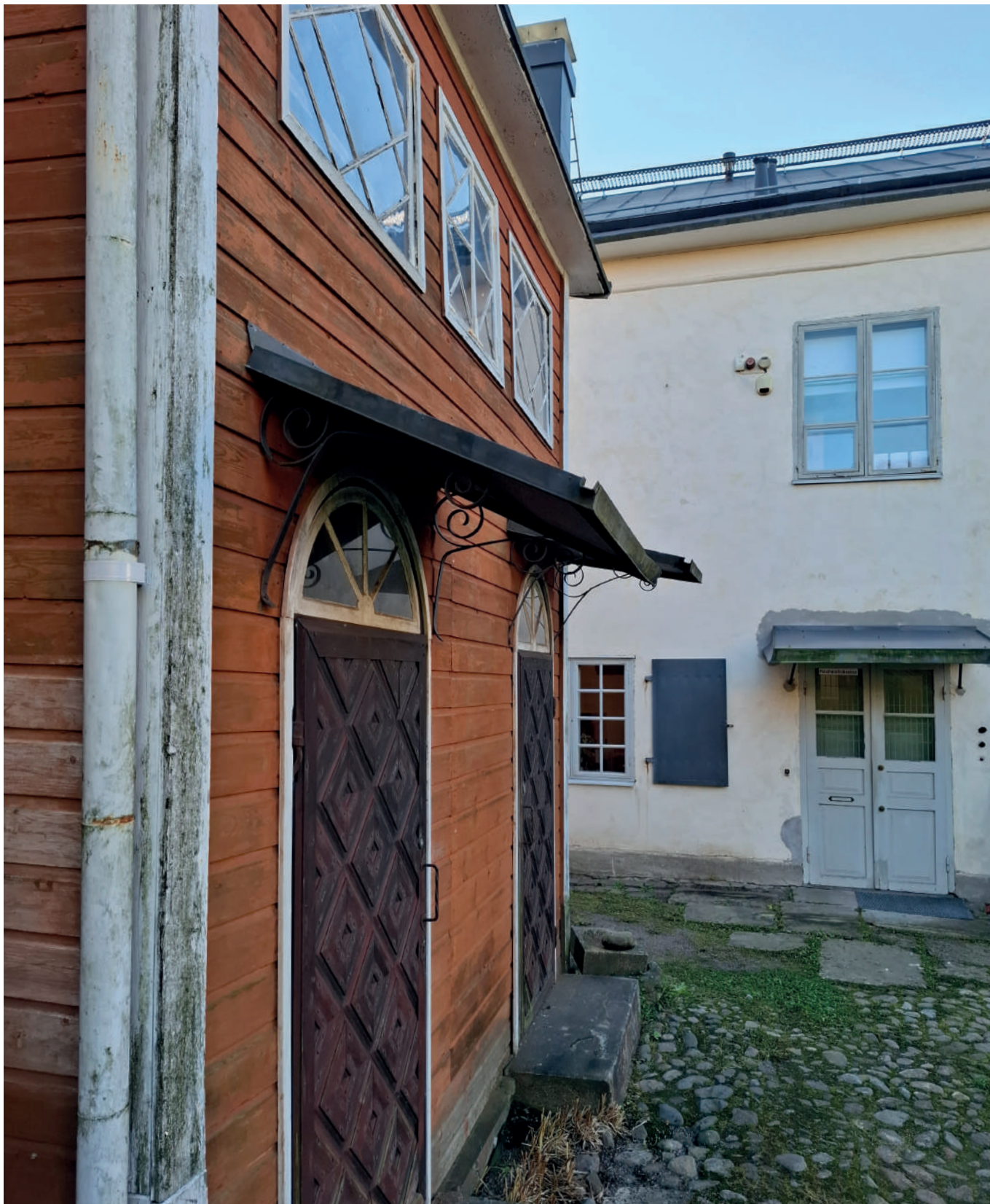
Wikmanska huset (till vänster).