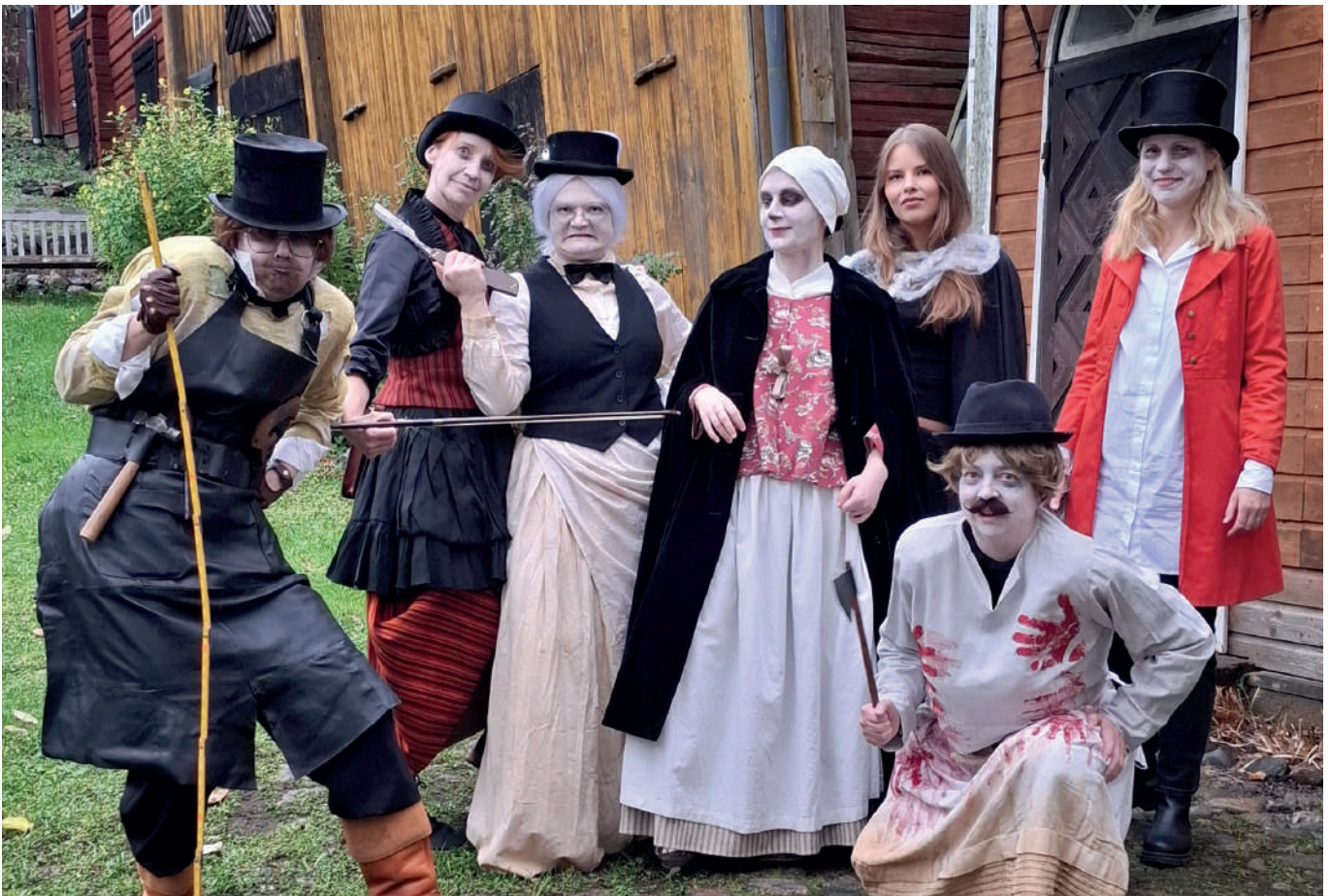
Personalen klädde sig till olika yrkesverksamma för evenemanget Spöknatten.