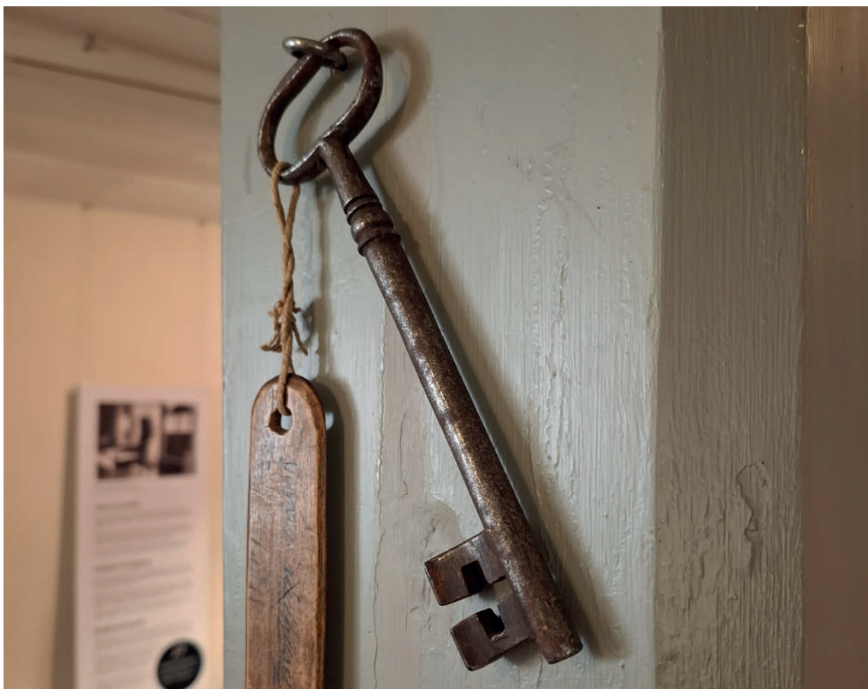
Den gamla nyckeln till huvudentrén som visas på utställningen Rådhusets historia.

Utställningen är en del av förnyelsen i museets utställningsverksamhet, och öppnade 26.3, i samband med Borgå museiförening rf:s årsmöte. Utställningen stöddes av Aktiastiftelsen i Borgå sr.