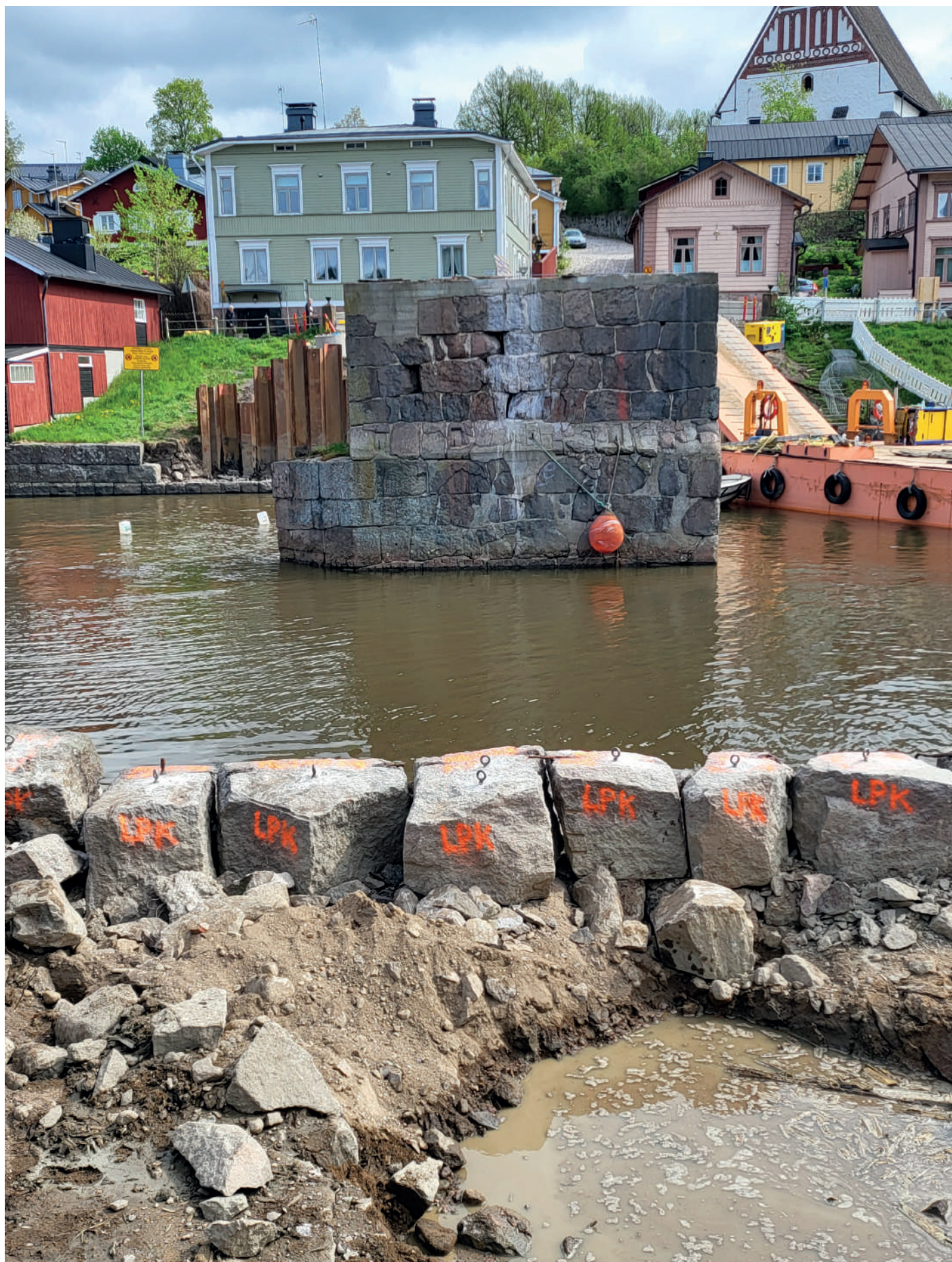
Byggforskaren Kirsi Toivonen och arkeologen Riikka Mustonen deltog i platsmötena för reparationen av gamla bron i Borgå.